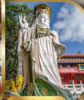
เจ้าแม่กวนอิม ริพลีสเบย์