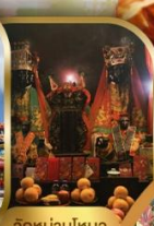
วัดบ้านใหม่