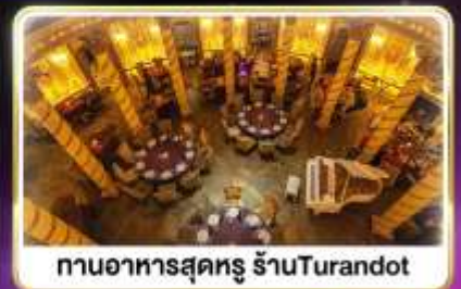
กานอาหารสุดหรู ร้านTurandot