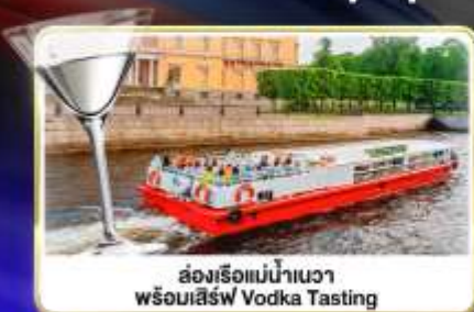
ล่องเรือแม่น้ำแคว พร้อมเสิร์ฟ Vodka Tasting