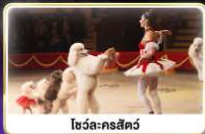
โชว์ละครสัตว์