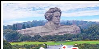
เกาะสั้มจวีจี้