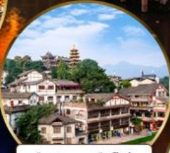
เมืองโบราณฉือจี้โฮว