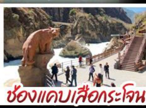
ช่องแคบเสือกะโจน