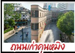
ถนนเก่าคุณหมิง