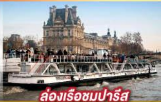
ล่องเรือชมปารีส