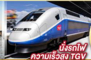
นั่งรถไฟ ความเร็วสูง TGV