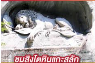
ชมสิงโตหินแกะสลัก