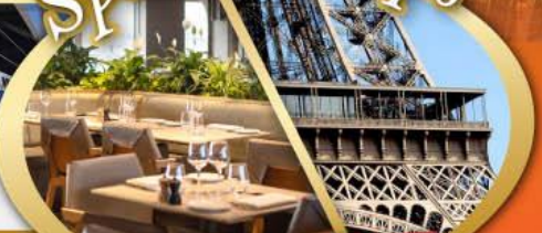
รับประทานอาหารกลางวัน บนหอไอเฟล

ไฮไลท์ในโปรแกรม • สะพานไมชาเปเล ลูเซิร์น