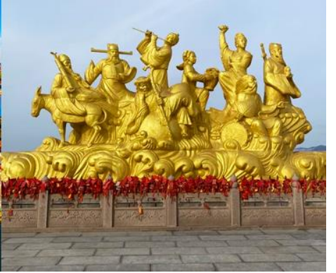
อุทยานทอวเกี้ยวแปดเซียนข้ามทะเล