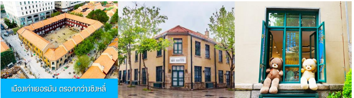
เมืองเก่าเยอรมัน ตรอกกว้างชิงหลี