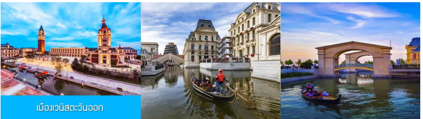
เมืองเวนิสตะวันออก

จากนั้นนำท่านเที่ยวชม เมืองเวนิสตะวันออก 大连东方威尼斯城 เป็นเมืองเวนิสจำลองที่ถูกสร้างขึ้นด้วยทุนกว่า 8,000 ล้านบาท ออกแบบโดยบริษัท ARC จากประเทศฝรั่งเศส โดยจำลองผังเมืองเวนิสในประเทศอิตาลี