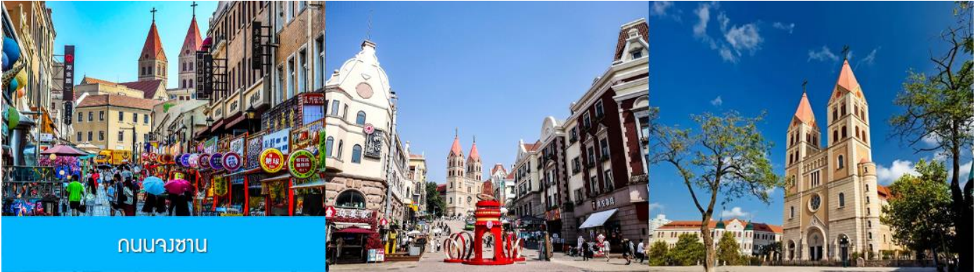
ถนนนางซาน