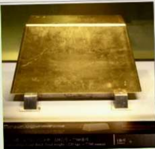
พิพิธภัณฑ์ทองคำ