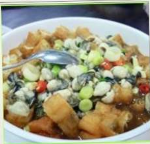
ถนนโบราณซือเฟิ่น