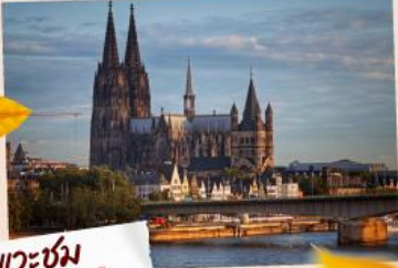
แวะชม มหาวิหารโคโลญ