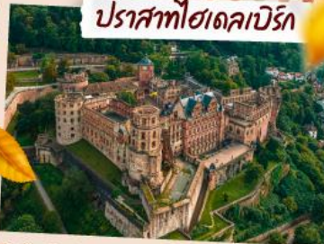
ปราสาทไฮคอบีร์ค