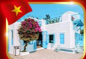
คาเฟ่สุดฮิค ซานทรา มารีน่า