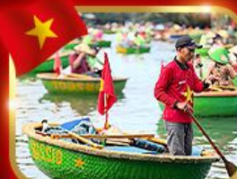
เรือกระด้ง หมู่บ้านกั๊กทาน