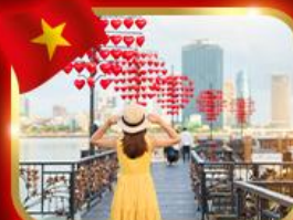
เซ็คอินสะพานแห่งความรัก