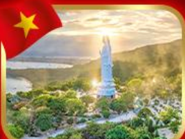
ซอพรกวอนอิม วัดหลัอัน