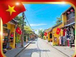
เมืองมรดกโลก ฮอยอัน