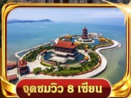
จุดชมวิวกว 8 เซียน