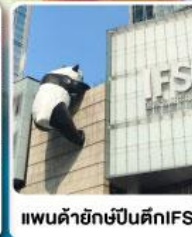
แพนด้ายักษ์ปีนตึกIFS