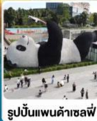
รูปปั้นแพนด้าเซลฟี