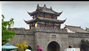
เมืองโบราณกวนเซี่ยน

ภูเขาสดรุณี - อุทยานπί้นผิงโกว - สะพานหนานเฉียว - ร้านหนังสือจงซูเก๋อ - เมืองโบราณกวนเสียน จตุรัสหย่าเทียนหวู่ - หมีแพนด้าเซลฟี - ถนนโบราณซอหยกวงซวยแพบ - ถนนคนเดินไท่กู่หลี่ ถนนคนเดินซุนซี - ถนนโบราณจิ่นหลี่ - แพนด้ายักษ์ปิงตึก - น้ำพุไม้ไผ่ตึกSKP - วัดต้าเฉียว