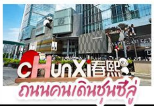
ถนนคนเดินชุนชี่ลู่