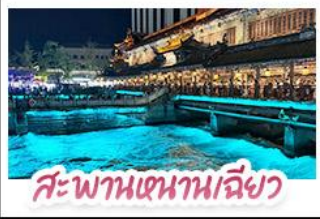
สะพานเสนาหนเจียว