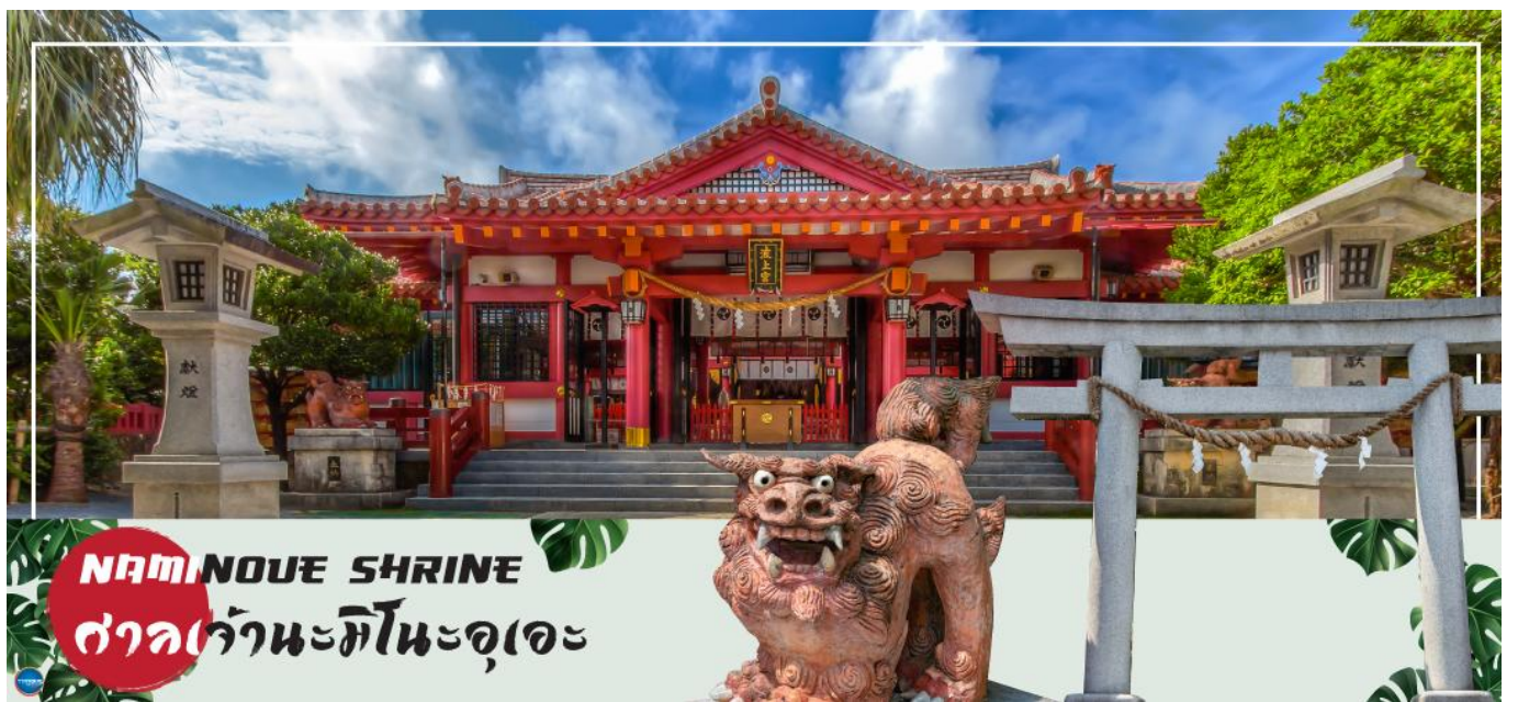
NAMINOUE SHRINE ศาลเจ้านะมิโนะอุเอะ

วันที่สี่ ศาลเจ้านามิโนะอุเอะ – ห้างสรรพสินค้า พาร์ค ซิตี้ – ทำอากาศยานนาสะ โอกินาวา – ทำอากาศยานดอนเมือง กรุงเทพฯ