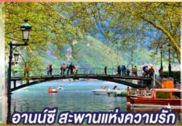
อานน์ซี สะพานแห่งความรัก