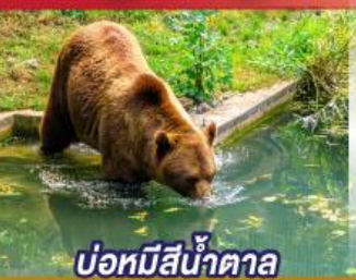
บ่อหมีสีน้ำตาล