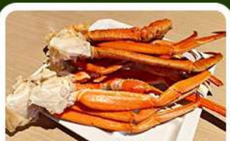
เมนูพิเศษ! ขาปู