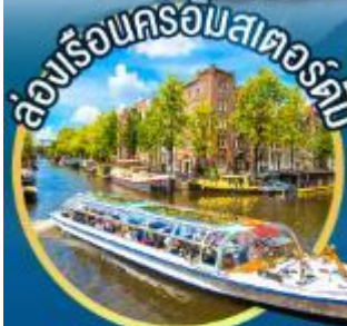
ล่องเรือชมเมืองแห่งสายน้ำ นครอัมสเตอร์ดัม