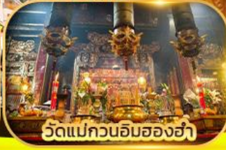
วัดแม่กวนอิมของฮ่า