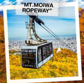
"MT. MOIWA ROPEWAY"