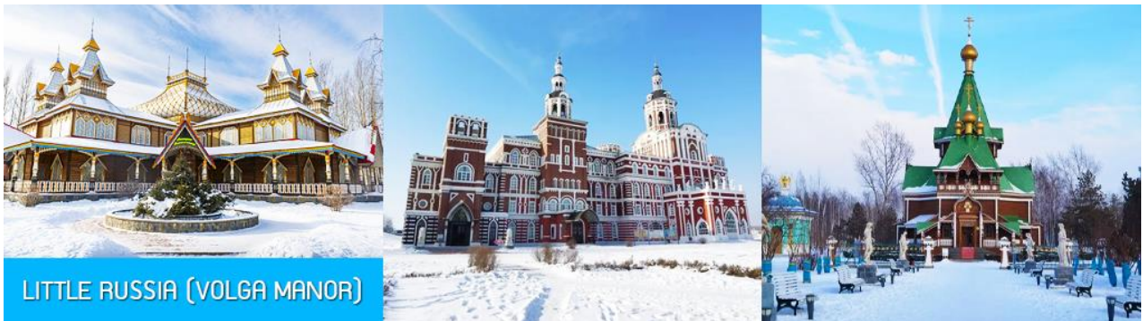
LITTLE RUSSIA (VOLGA MANOR)

รับประทานอาหารเช้า ณ ห้องอาหารของโรงแรม (13)