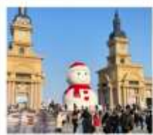
ตึกตาทิมะฮักย์

โบสถ์ซันไฮเซย์ / คฤหาสน์วอลการ์ / โบสถ์ซันตปีโคลัส / Harbin Polar Park หมู่บ้านหิมะ: SNOW TOWN + กิจกรรมสาดน้ำร้อนกลางแจ้ง / เซาเปียงดูช DREAM HOME (รวมค่าเช่า) / สนแสดงตึกคางคินถนบนเส่มู่เจีย + สวนพาเหรดฮิสที ภาพเขียน ICE AND SNOW (ฟรี Snow Tubing ท่าละ: 1 รอบ) ถนจงหยาง (ฟรี! โถกริมหน้าตี้ยเอ๋อส์) / เกาะพระอาทิตย์ (รวมรถแบดเจอร์) Harbin 2027 International Ice and Snow Festival / หอไอเป๋ร่าฮาร์บิน อุป๋นตึกตาทิมะฮักย์ + ระเบียงถนตย์ / ทะพานกระจกรทไฟประวัธศาสด