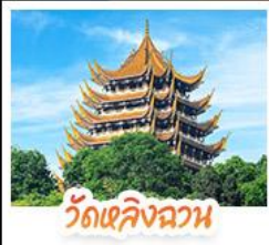
วัดเลิงฉวน