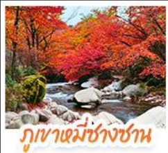
ภูเขาเขาน้ำร้อน