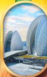
โรงละครโหลท