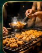
สตรีทฟู้ดชื่อดัง