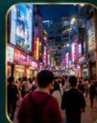
แหล่งช้อปปิ้งแฟชั่นสุดฮิต