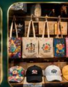
ของฝากเก๋ ๆ