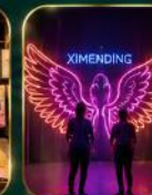
จุดเช็คอินสุดฮิต

เย็นที่พัก อิสระรับประทานอาหารตามอัธยาศัย นำท่านเข้าสู่ที่พัก YI DEAR HOTEL หรือเทียบเท่าระดับ 3-4★