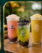
เครื่องดื่มยอดนิยม