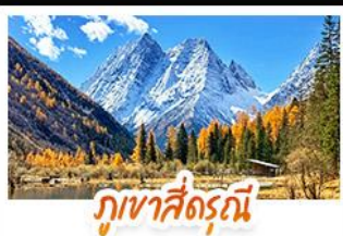
ภูเขาสี่ฤดู

ชมทะเลสาบสีฟ้ามรกต ณ จิวจ้ายโกว • เช็กอิน "ภูเขาสี่ฤดู" สัมผัสความงดงามของไปไม้เปลี่ยนสี ชมทิวทัศน์ภูเขาหิมะติดกับเนินป่าสีทอง • ชมแอ่งน้ำสีฟ้ามรกตสุดมหัศจรรย์ ณ อุทยานหวงหลง • ช้อปโป๊วจิว โกวไม้เท้าหิมะ และถนนคนเดินซุนชี่ตู้พิเศษ! นั่งรถไฟความเร็วสูง 1 ชม. สู่เมืองเจียงตู