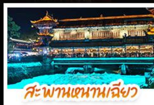
สะพานเทียนเฉียว