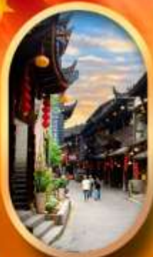
เมืองโบราณฟูหลงเจี้ยน