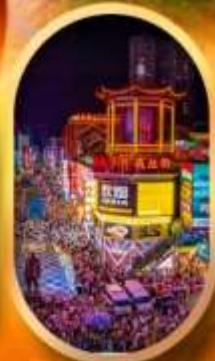
ถนนคนเดินซิงลู่