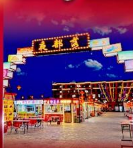
ตลาดกลางคืน ทาลาเดอซี