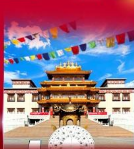
วัดพระโพธิสัตว์ ดูลาน