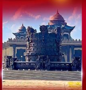
ศูนย์วัฒนธรรม มองโกเลีย หยวนหลิว