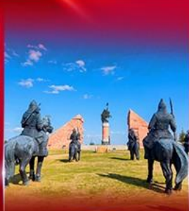
สวนสาธารณะเจงกิสข่าน