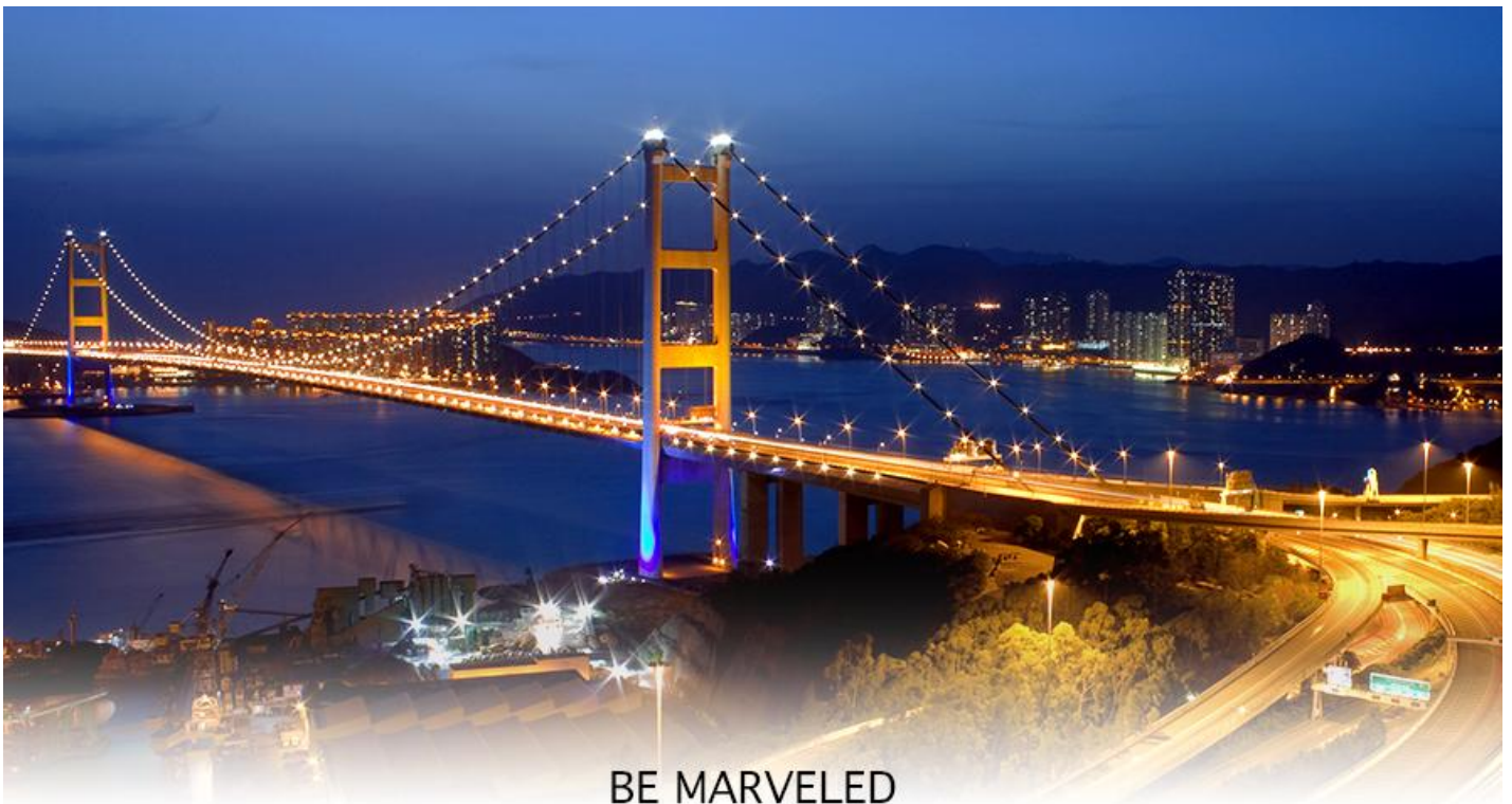
BE MARVELED สะพานแขวนชิงหม่า

17.40 น. เดินทางถึง สนามบินเซ็กแล็บก๊อก (CHEK LAP KOK INTERNATIONAL AIRPORT) เขตปกครองพิเศษฮ่องกง หลังผ่านพิธีการตรวจคนเข้าเมืองเป็นที่เรียบร้อยแล้ว รับกระเป๋าสัมภาระ เดินทางโดยรถโค้ชปรับอากาศ (เวลาที่ท้องถิ่นที่ฮ่องกง เร็วกว่าประเทศไทย 1 ชั่วโมง)