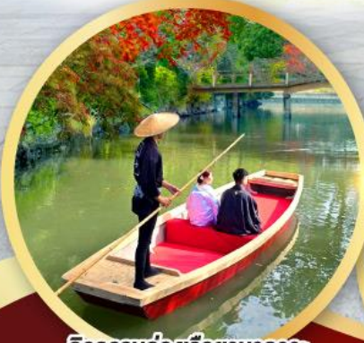
กิจกรรมล่องเรือยามากาวะ