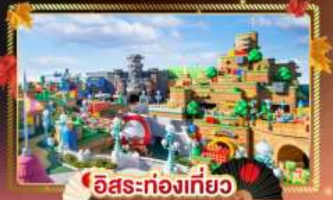
อิสระท่องเที่ยว