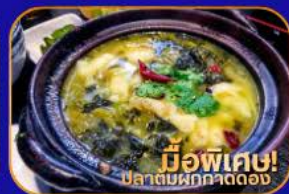
มีอพิเศษ! ปลาต้มผักกาดดอง