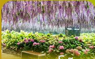
สวนนกเปาเม็ย