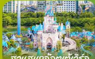
สวนสนุกโลกอเตเวิร์ล Lotte Adventure World