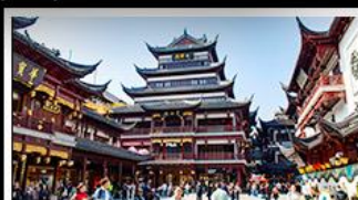
ตลาดร้อยปีเจิ้งหวงเหมียว