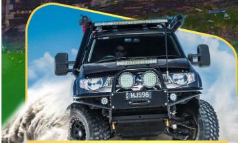
คันรถ 4WD สู้อีกกลางเทือกเขาคอเคซัส