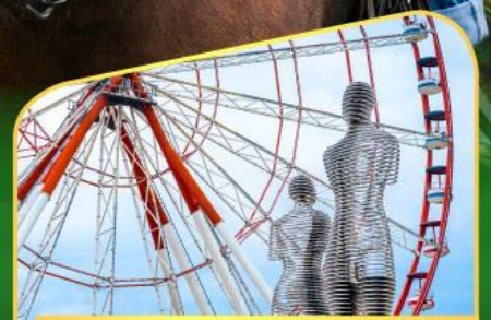
อนุสาวรีย์อาลีและนีโน่