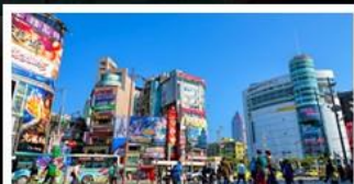
ซ้อปั้งซีเหมินตึง