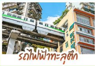
รถไฟฟ้าทะเลสาบสี่ดรุณี

ชมธรรมชาติ ณ อุโมงค์ ชมหุบเขาสุดอลังการระดับมรดกโลก นั่งรถไฟฟ้าทะเลสาบสี่ดรุณี สัมผัสกลิ่นเหมืองทองซึ่งสุดล้ำ สัมผัสวิถีภูเขาหิมะแห่ง ภูเขาสี่ดรุณี งดงามจนได้รับฉายา "เทือกเขาแอลป์แห่งตะวันออก" ชมธรรมชาติสุดฟิน ณ อุทยานปี่ผิงโกว • ช้อปปิ้งจุใจ ถนนคนเดินไท่กู่หลี่, ถนนคนเดินซุนซู่