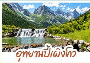
อุทยานปี่ผิงโกว