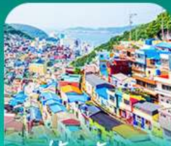
หมู่บ้านคิมชอน