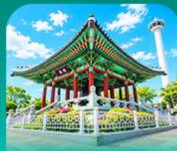
สวนจงดูซาน