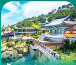
วัดแฮดองซงกุงซา

เที่ยวปูซานแบบแกรนด์ แกรนด์ ทั้งสายอาร์ก สายบู และสายช้อปปิ้ง • เช็กอินแบบถ่ายรูปสุดคิลเลอร์ฟูล ที่ท่าเรือจินมิม (BUSAN BUNEZIA) เดินเล่นหมู่บ้านคิมชอน ชมโบสถ์แม่แห่งปูซานสุดน่ารัก พลาดไม่ได้กับการนั่งรถไฟปีกนก ชมวิวทะเลเมืองปูซาน • เสริมสิริมงคลที่วัดแควดยงกุงซา วัดริมทะเลชื่อดัง พร้อมช้อปปิ้งที่ลือเลื่องมีเยมอ่ากิลีต และตลาดนัมโพดง ก่อนปิดท้ายด้วย ย่านวัยรุ่นสุดชิค ซอ มยอน อีวโด พร้อมชมวิวสะพาน ควังอันยามค่ำคืนสุดโรแมนติก