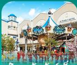
ลือเลื่อง อ่ากิลีต