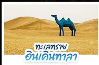
ทะเลทราย อินเคินทาลา