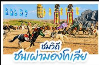
ชมวิถี ชนเผ่ามองโกเลีย

เปิดประสบการณ์ พักแรมมองโกเลียสุดพรีเมียมกลางทุ่งหญ้า สัมผัสบรรยากาศพระอาทิตย์ขึ้นสุดโรแมนติก ชมวิถีชนเผ่ามองโกเลีย พร้อมปาร์ตี้กองไฟใต้ท้องฟ้าเต็มไปด้วยความ • ตะลุยทะเลทรายอินเคินทาลา ทำรูปสุดปังกลางทะเลทรายสีทอง • เที่ยวครบทั้งทุ่งหญ้าเออร์โดส วัฒนธรรมมองโกเลีย และเมืองสุดโมเดิร์นในกรีปเดียว แบบสวยหรู ดูแพงทุกวิน