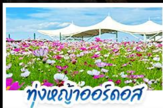
ทุ่งหญ้าเออร์โดส