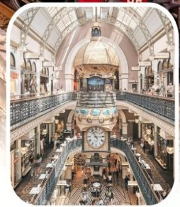
QUEEN VICTORIA BUILDING