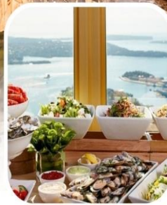
SKYFEAST BUFFET SYDNEY TOWER