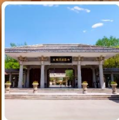
อุทยานประวัติศาสตร์จิวจวน

ไฮไลท์! เขตท่องเที่ยวเทียนจิงจางหม่า ชมทุ่งหญ้าและภูเขาสวยแห่งกานซู ภูเขาสายรุ้งจางเย่ต้นเสี๋ย "มหัศจรรย์ภูเขาสายรุ้งหลากสี"