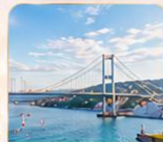
BOSPHORUS STRAIT ช่องแคบบอสฟอรัส