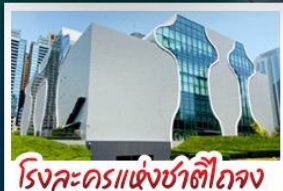
โรงละครแห่งชาติไทเป

รถไฟอาลีซาน - ล่องเรือสุริยันเจ็ทตรา ตึกTaipei 101 - โรงละครแห่งชาติไทเป ซีเหมินติง - อนุสรณ์สถานเจียงไคเช็ค