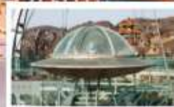
UFO Glass Platform