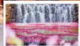
น้ำตกทะเลสาบไห่ 7 สี

🗳️ โหลด 23 KG. x1 ทั้งไป - กลับ ✓ ฟรีนียบตัว ✓ ไม่เข้าร้านรัฐบาล ✓ ทีวีรูปเล็ก ✓ รวมค่าเข้าสถานที่ตามโปรแกรม