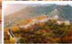
กำแพงเมืองจีน ด่านปาต้าหลิ่ง