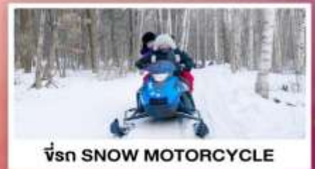
ขี่รถ SNOW MOTORCYCLE