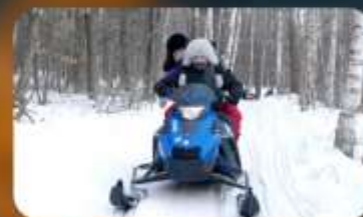
จักรยาน SNOW MOTORCYCLE