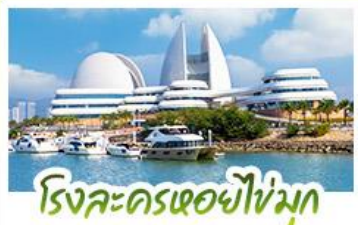
ริ่งละครเซอซำหมุก