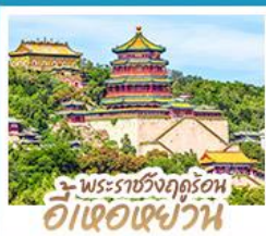
พระราชวังฤดูร้อน อี่เซว่เซว่น

ทริปเดียวเที่ยว 2 เมือง ปักกิ่ง-ต้าเหลียน • เที่ยวจีนฟัลยูโรป ณ เมืองวนนิสแห่งต้าเหลียน • สัมผัสประสบการณ์ขึ้นกำแพงเมืองจีน ด่านจวิยงกวน • ซ้อป ซิม ซิล ที่ถนนโบราณคกงวนและย่านชานหลี่กุน