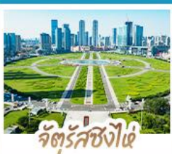
จัตุรัสชิงไผ่