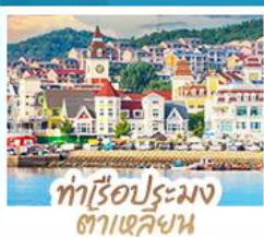
ท่าเรือประมง ต้าเหลียน