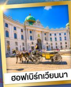
ออฟเบิร์กเวียนนา

เข้าชมความงดงามภายใน ของปราสาทนอยชวานสไตน์