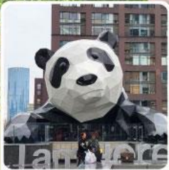
แพนด้าปิ่นตึก IFS